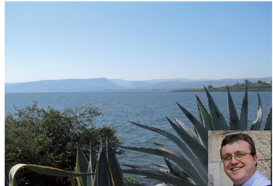
Le lac de Tibériade

Découverte des lieux bibliques, marches accessibles à tous et haltes spirituelles